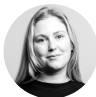
Sofie Fraser Mail Signal Telefon

Til sammen har Troll og Tydal tilgang på kraft på rundt 247 megawatt. Til sammenligning har det omstridte elektrifiseringsprosjektet på Melkøya fått reservert 350 megawatt.